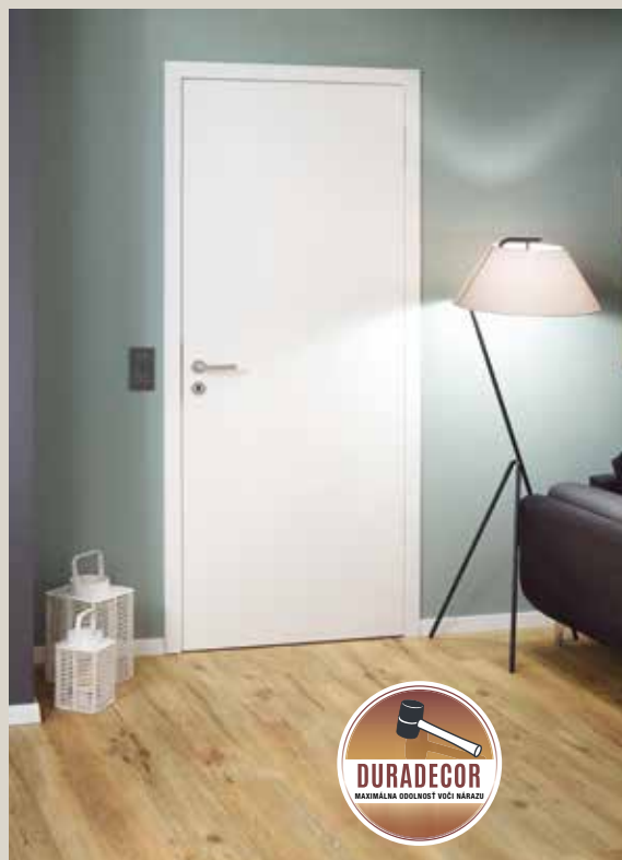
Obrazok: Interiérové dvere s bezfalcovým krídlom dverí, skryto umiestnenými závesmi a s povrchom Duradecor vo farbe RAL 9016 biely lak