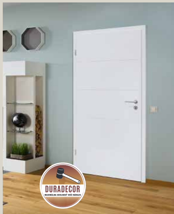
Obrázok: Interiérové dvere s falcovaným krídlom dverí s vyrazenými drážkami, povrch Duradecor biely lak RAL 9016